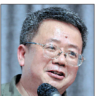
桑农 学者、随笔作家, 任教于安徽师范 大学