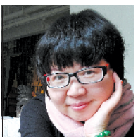
乔叶 作家,河南省作协 副主席,曾获鲁迅 文学奖