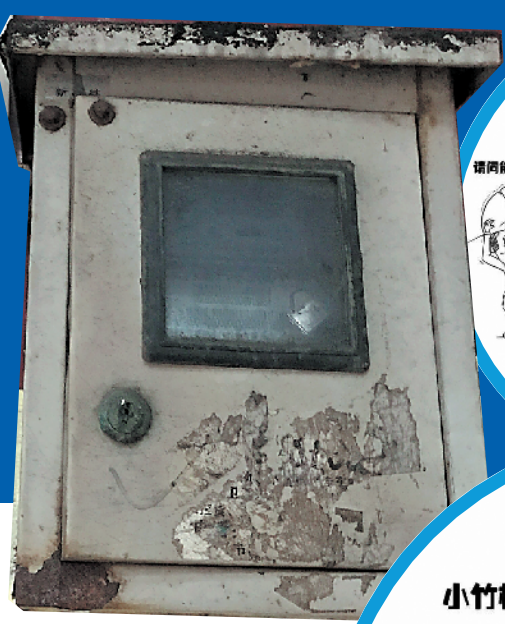
现在居民楼下的电表