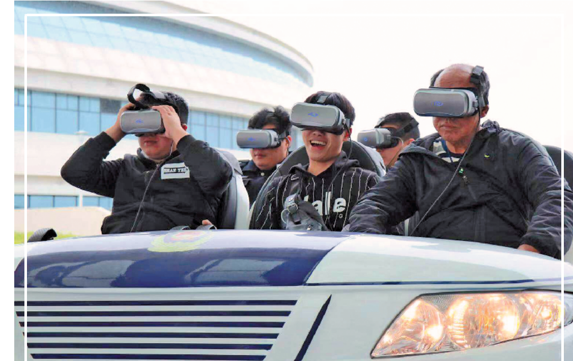
市民体验VR交通事故警示体验装置

《监管办法》还明确,未取得预售许可证而销售或者以内部认购、内部认筹等方式变相销售商品房的房地产开发企业,将被责令停止违法销售行为,并以每销售一套商品房罚10万元的标准接受处罚。