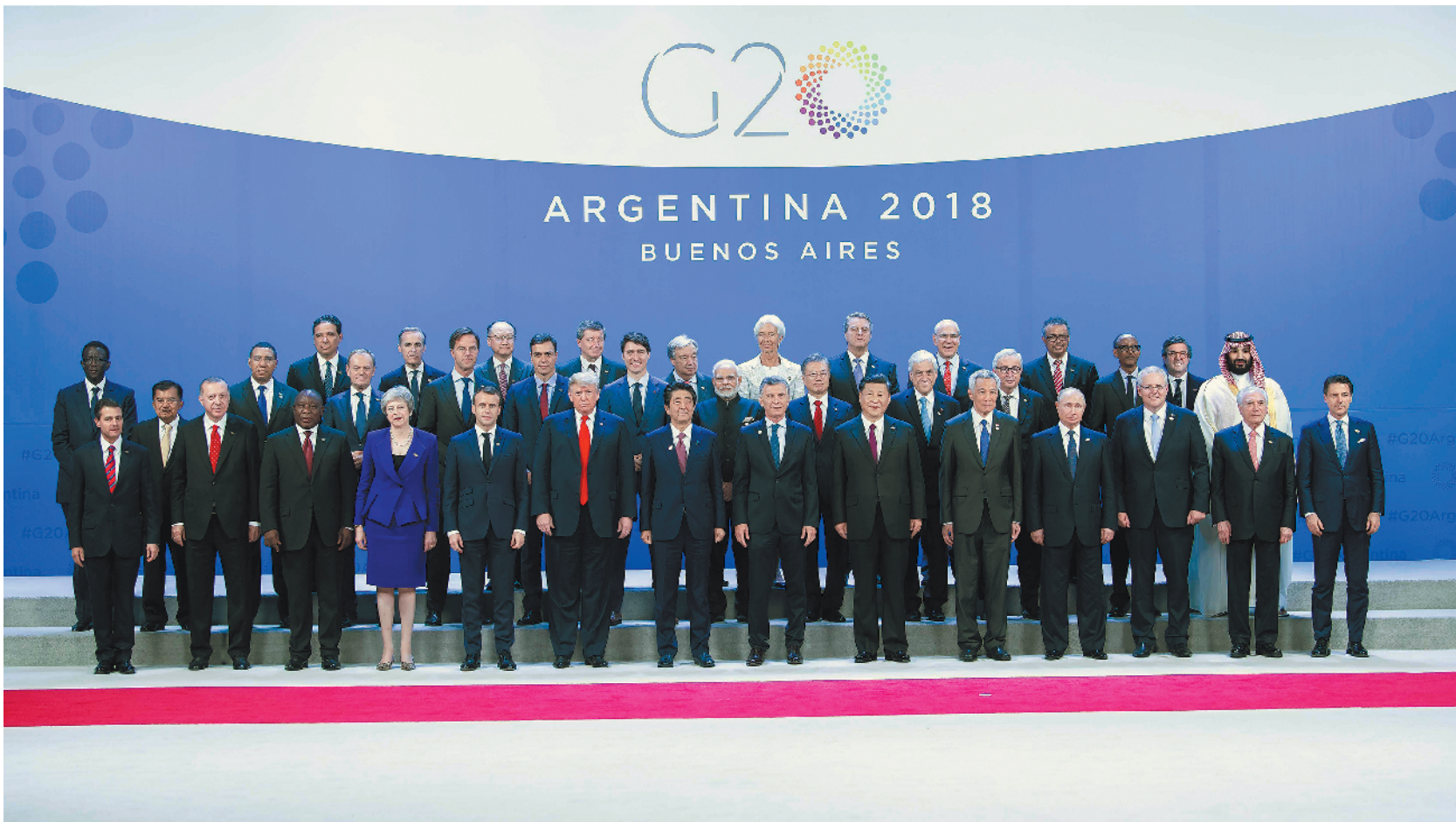
习近平同其他与会领导人合影