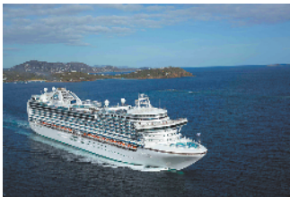
海上邮轮之旅适合一家大小

的地也是寒假遛娃的热门之选。驴妈妈平台数据显示,今年寒假带孩子出行的订单相比去年增长近两成,杭州、苏州、广州、上海、珠海、北京、黄山、常州、无锡、嘉兴成为最受欢迎的周边旅游目的地,上海迪士尼乐园、常州恐龙园、广州长隆野生动物园、北京八达岭野生动物园、上海科技馆、四川大熊猫保护研究中心等均为人气景点。