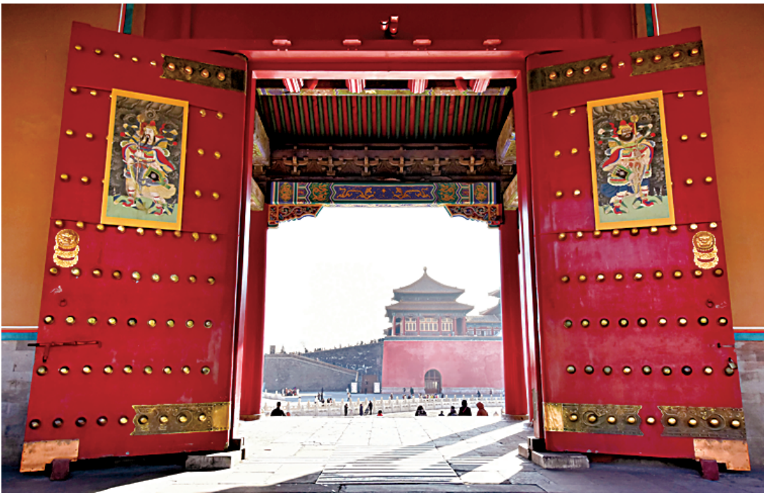
北京故宫吉祥喜气,年味浓