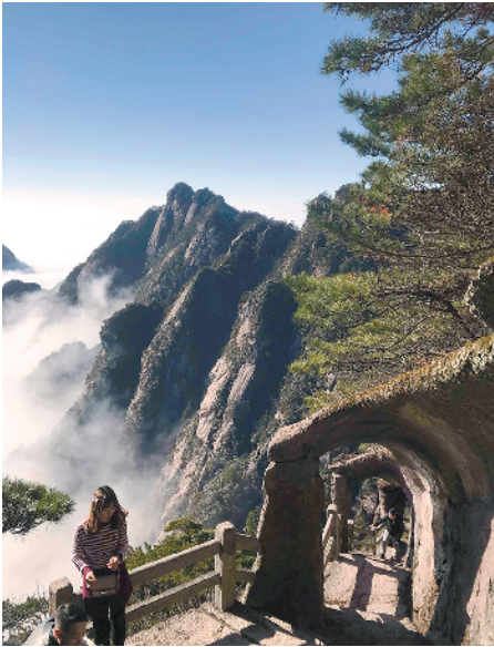
冬日黄山是人文旅游及登高游热门地

旅行社提醒市民:寒假出游高峰已开启,报名人数日渐走高,部分签证便利的东南亚出境中短线以及国内游线路余位已不足二成,出境游目前能够报名的主要集中在东南亚等签证时间限制较低、航线量大的线路,如马来西亚沙巴、泰国曼谷、芭堤雅等,有需要的市民应尽早进行咨询预定,以免耽误出行。