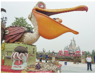
上海迪士尼乐园花车巡游