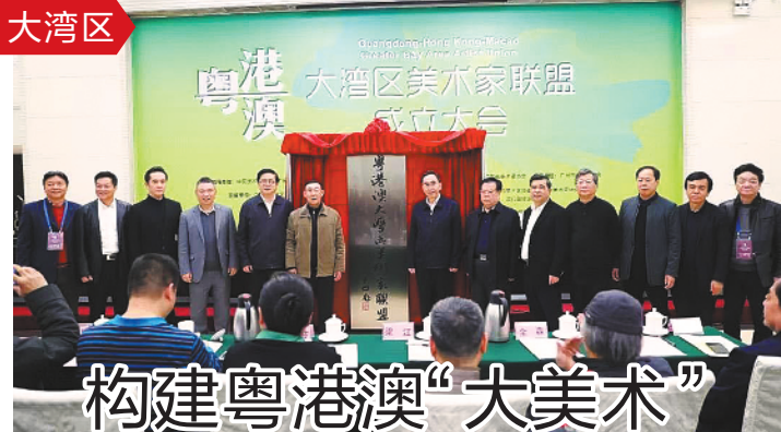
羊城晚报记者 朱绍杰

差。“右键事件”就是典型。“如果你一点数商都没有，那你就是这个时代的牺牲品，就是这个商业时代的牺牲品。”现场分享的两本新书中，《数据之美》这本书，从小数据时代到大数据的崛起，涂子沛以宏大的历史观、文化观、大数据观，给我们描绘了一幅数据科学、智慧文化的全景图。《数文明》是涂子沛的最新力作，分析了社会和文明的文明史，找出了文明发展的“金线”，这条文明发展的“金线”也同样适用于个人，可以帮助个人获得职业上和专业的成功。