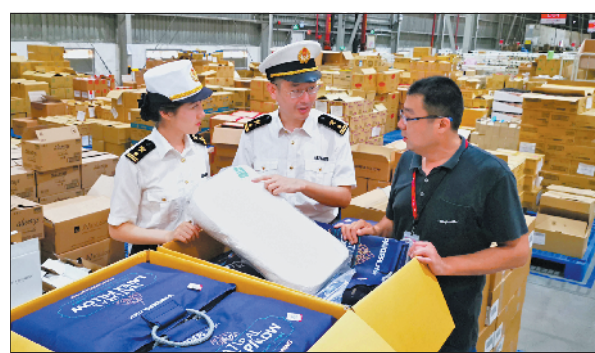
广州海关关员验放进口商品

羊城晚报讯 记者马汉青、通讯员关悦摄影报道：记者19日获悉，广州海关“618”期间验放15.7亿元跨境电商进口商品，同比增长27.6%。为应对跨境电商碎片化、频次高的通关特点，广州海关实现全程无纸化通关及税收代收代缴模式。通关手续全程无纸化，极大契合跨境电商特点，还有效提高了通关效率。广州海关还推出“网购保税进口商品入区单自动审核”“创新税款担保模式”等多项措施，提升了现场的工作效率。关区内95%以上的商品实现了“秒放”。 据统计，今年“618”电商大促活动期间(6月1日至18日)，广州海关共验放跨境电商进口商品清单555.7万票，监管货值达人民币15.7亿元，与去年同期相比分别增长18.9%和27.6%，商品集中在母婴用品、化妆品、小家电等。