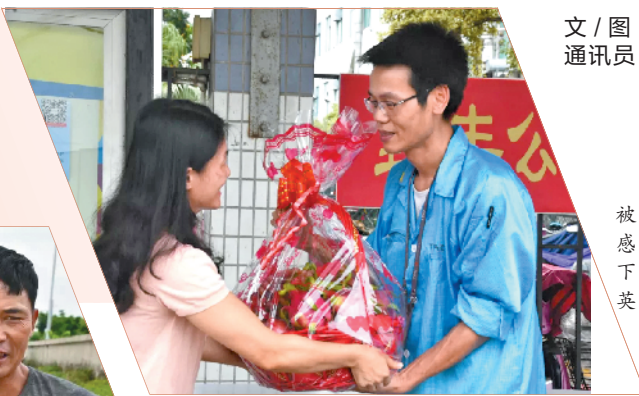
文/图 羊城晚报记者 甘韵仪 通讯员 谭阳春 黄国宏 番禺

6月16日,一对父子在广州市番禺区观龙岛水域不慎落水。生死关头,三名过路村民挺身而出,将父子俩从河中救起,随后悄然离开,没有留下姓名和联系方式。被救的父子为寻找恩人,借助媒体发布信息。6月19日,在网友的帮助下,终于找到了两位英雄,故事背后很温暖——