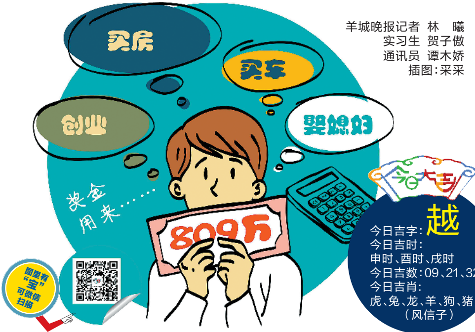
羊城晚报记者 林曦 实习生 贺子傲 通讯员 谭木娇 插图: 采采

今日吉字: 越 今日吉时: 申时、酉时、戌时 今日吉数: 09、21、32 今日生肖: 虎、兔、龙、羊、狗、猪 (风信子)