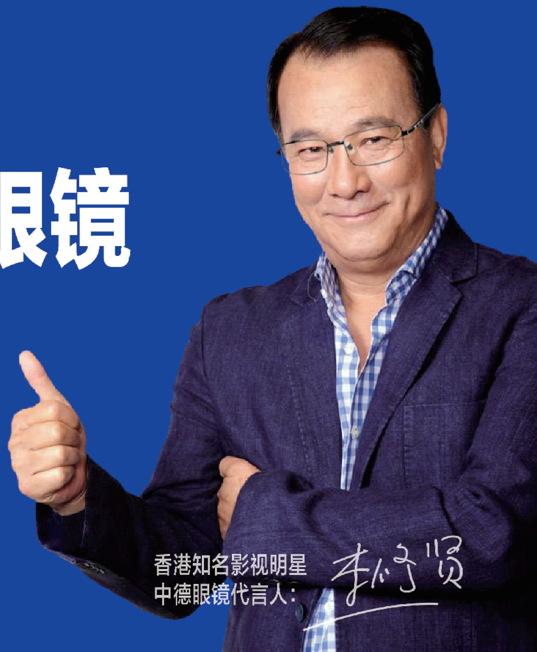
香港知名影视明星 中德眼镜代言人: 李修贤

不一样的高清晰度 一副镜片含有数万个焦点, 精准对应每个眼球的视觉数据; 看远看近更清楚。