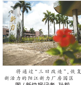
将通过“三旧改造”,恢复新活力的阳江新力厂房园区

羊城晚报讯 记者王丹阳报道:近日,一则民企500强、宁波前首富的公司银亿集团申请破产重整的消息,引发外界对于明星企业破产重整的广泛关注。记者注意到,破产重整不同于破产清算,重在让濒危的企业恢复活力。近日,广东企业也有破产重整新案例。6月18日,自2015年停产、对外涉及债务超过5亿元的阳江汉能工业等三家企业,其合并破产重整案迎来曙光。经过多方努力,在第三次破产重整债权人会议上,公布了包括恢复生产、引资上高新科技项目的企业重整草案被高票通过的结果。这是阳江近十年第一个市场化、法制化的破产重整项目,也将为地方停产企业如何“死而复生”提供借鉴。