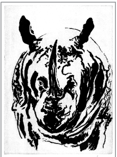
犀牛罗西 2006年 玛吉·汉布林

汉布林的肖像画则描绘了她深爱的各个对象：过世的父亲、母亲、情人、老师，亦包括自画像。约翰·伯格曾写过《235天》一书，讲述汉布林与恋人亨利埃塔·莫莱伊长达235天的动人故事。她一遍一遍地描绘深爱的人，直至他们濒死和过世，仍不停止。对汉布林来说，“爱是所有艺术创作的基础”，激情的、混乱的、温柔的、脆弱的。汉布林的画就是她内心的最真实写照。