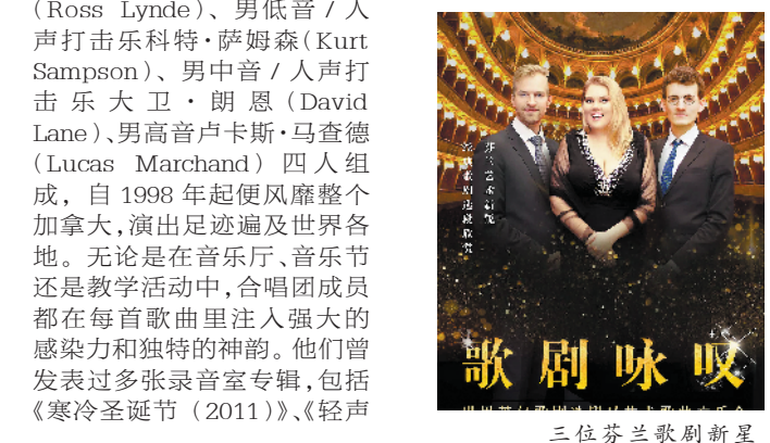
加拿大韵律人声合唱团