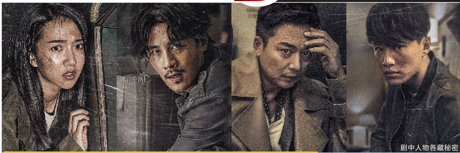
冒险剧《无主之城》带来不一样的观剧体验