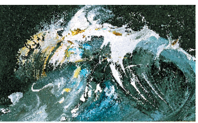
翻滚之浪 2008年 玛吉·汉布林