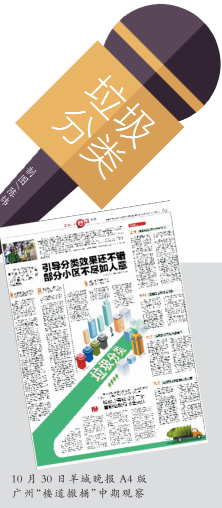
10月30日羊城晚报A4版 广州“楼道撤桶”中期观察