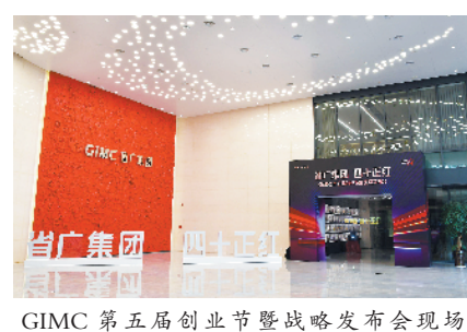
GIMC第五届创业节暨战略发布会现场

据悉，站在四十年发展的新的历史起点上，省广将努力用更好的成绩回报投资者，用更专业的服务能力回馈客户，以国际化营销集团的崭新姿态，重新定义省广在数字时代的发展。