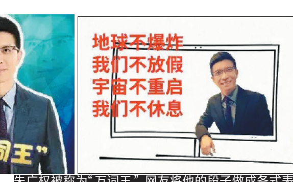
地球不爆炸,我们不放假;宇宙不重启,我们不休息

可以说,“央视F4”的出圈,是粉丝思维和社会化传播合力的结果。主持人向社交网络明星、大V转化,带来了极大的号召力。此外,他们之间的互动,也在社会化传播的作用下,巩固了受众粘性。例如,最近康辉和朱广权的互动,又狠狠刷了一波热度。11月中旬,朱广权在微博转发网友发布的一张神似康辉的松鼠图片,并评论道:“太过分了,怎么能放生呢?”当时,有网友呼吁身为“领导”的康辉现身反击,没想到,朱广权随后发了一条央视播音部的群聊记录,聊天中显示康辉看了图片说:“准备让朱广权值一个礼拜手语班。”