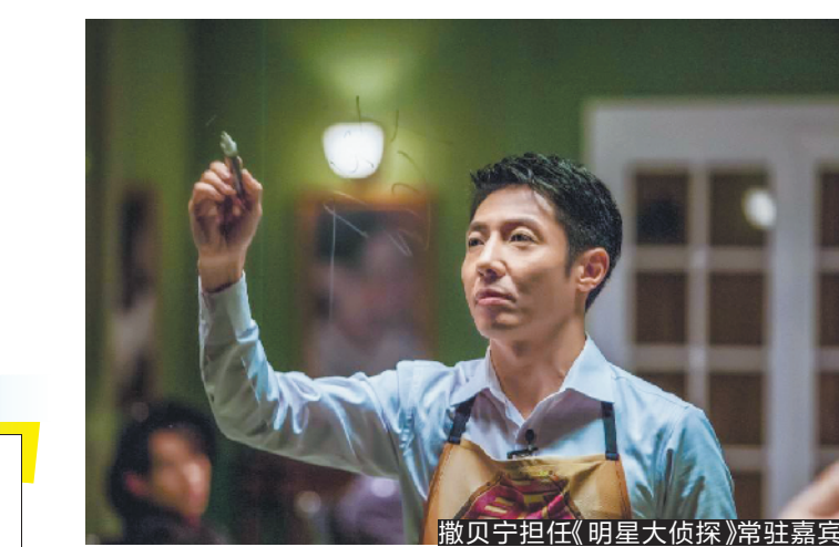
撒贝宁担任《明星大侦探》常驻嘉宾

康辉1972年生于河北保定,本科毕业于北京广播学院(今中国传媒大学),硕士毕业于北京大学。此前,康辉给观众的印象是一本正经、不苟言笑的播报《新闻联播》,即便主持央视联欢晚会,他的风格也和轻松、活泼的综艺感无关。但是,今年不少观众发现,康辉变了,甚至央视新闻也变了。今年7月29日,央视新开了短视频栏目《主播说联播》,央视《新闻联播》的康辉、欧阳夏丹、李梓萌、海霞等主播悉数发表短时评。其中康辉的一堆视频都红了,例如,他活用了当时黄晓明在《中餐厅3》中的“明言明语”评论美国一些政客:“美国一些人总是一副‘霸道总裁’的做派:我不要你觉得好,我要我觉得好。”