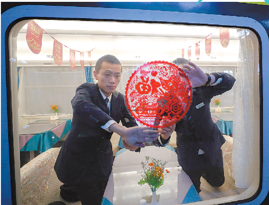
▲重庆西站K4673次列车上的乘务员,在旅客上车前贴好了喜庆的窗花

1月10日凌晨,2020年“春运”正式启动。铁路线上的动车、高铁早就整装待发,也开始忙碌起来。锃亮的高铁车头、舒适的动车车厢、干净的卧铺被褥……最重要的是每一程安全的驾驶,都让春运归家途上的人个个春风拂面。而这些愉快场景的背后,其实有我们想象不到的细致与辛苦。