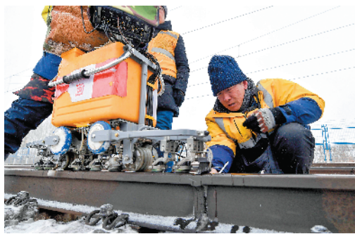
▲中国铁路沈阳局集团有限公司长春工务段的“探伤工人”正在像B超医生一般,利用超声波探伤仪等仪器对铁路钢轨进行“体检”,检查是否存在肉眼瞧不出的“疑难杂症”