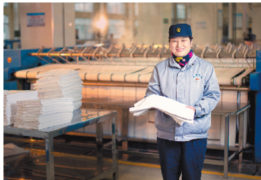
▲在武汉客运段洗涤中心内,卧具洗涤员会把所有送来的卧具洗涤得干干净净,熨烫得平平整整,只为让旅客都能乘坐干净舒适的火车回家