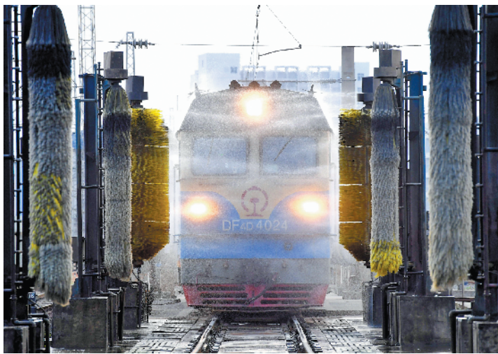
▲中国铁路南宁局集团有限公司柳州机务段的“火车4S店”通宵忙碌,火车机车正通过一套自动清洗设备