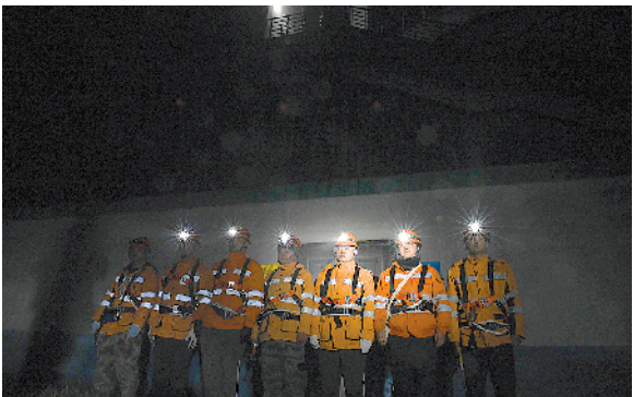
▲1月10日凌晨,合肥工务段安庆大桥车间的“桥隧工”正准备进入作业区。他们要利用每周四次的0点到4点列车停运的“天窗期”,登上安庆长江铁路大桥桥面对桥梁进行检查和保养,确保高铁平稳顺畅通过大桥

►太原工务段佛峪桥隧工区的“打冰人”在隧道里打冰。他们每年10月底到第二年春天,主要工作就是对20余条隧道的200多处结冰隐患点进行排查、处理,而每次出巡通常都要步行超过12公里