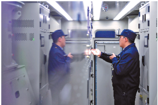
▲青藏铁路公司西宁车辆段动车车间的“打温人”,正在冬夜里为动车组“驱寒保暖”。他们要每隔两小时,就对库内动车的所有设施设备进行巡视检查,控制车厢供电设施,维持车厢温度不低于18℃