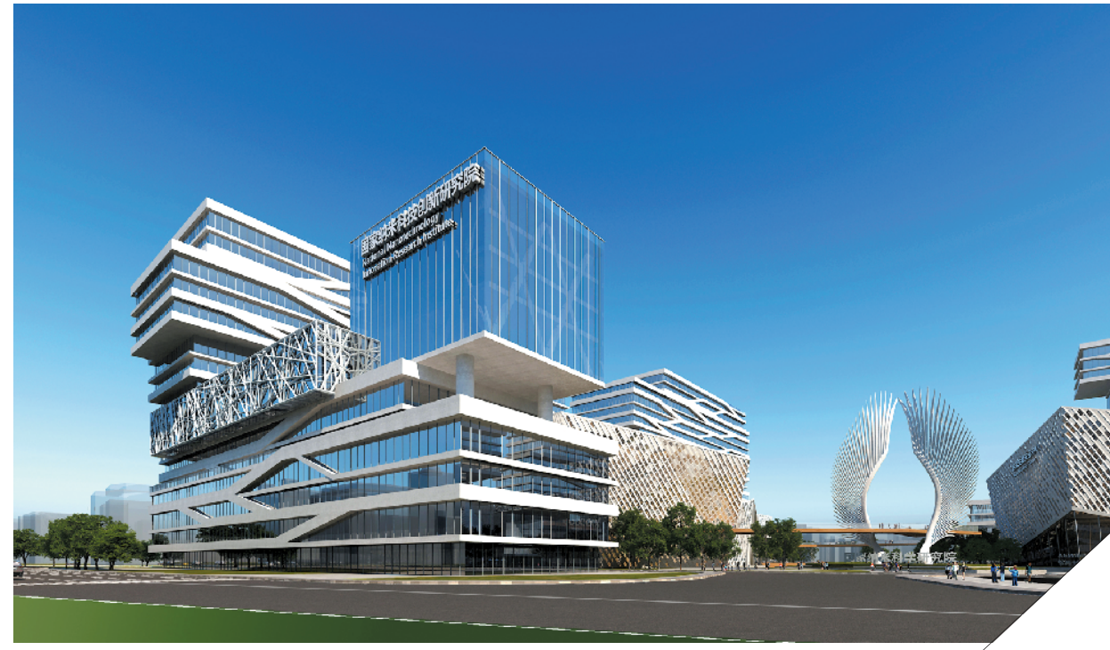
广东粤港澳大湾区国家纳米科技创新研究院效果图

广纳院还将引进在国际上最早开展纳米生物安全研究的中科院纳米生物效应与安全重点实验室研究团队，启动建设全球首个纳米生物安全中心——广东粤港澳大湾区国家纳米科技创新研究院纳米生物安全中心。此次新冠肺炎疫情暴发之初，该中心迅速启动了新冠病毒检测试剂盒研发项目。目前，该试剂盒已进入国家药监局快速审批，已在武汉定点医院收治院开展临床试验。当天活动得到了22位院士的热烈响应，钟南山、袁隆平等发来祝贺视频。