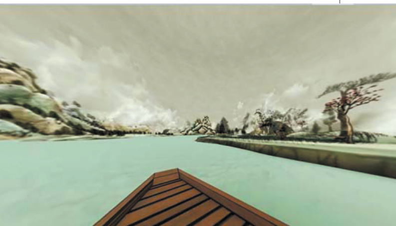
《秋兴八景图》虚拟游览