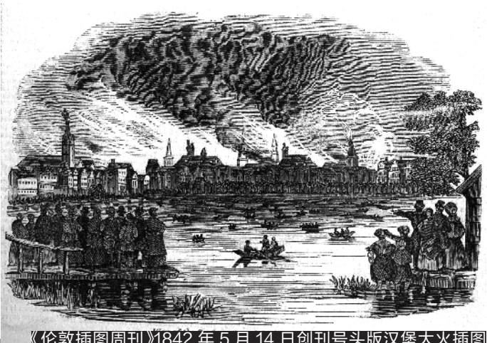
《伦敦插图周刊》1842年5月14日创刊号头版汉堡大火插图

欧洲不少报纸报道了“汉堡大火”。世界上第一份插图周刊《伦敦插图周报》1842年5月14日的创刊号头版上就有“汉堡大火”版面插图。《伦敦插图周报》2003年停刊。