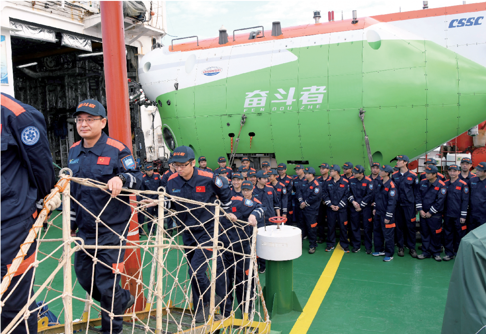
成功坐底10909米深海的“奋斗者”号胜利返航

据介绍，“奋斗者”号的成功海试，充分验证了潜水器各项功能、性能以及我国在深海装备和深海技术上的突破，标志着我国进入深海科考第一梯队，将为我国后续深渊深海科学研究提供强有力的技术支撑，推动我国科学家积极参与国际深渊科考活动，同时有利于培育相关设备产业的发展。