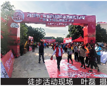
徒步活动现场

其中,广东省乡村民俗徒步运动会以徒步为核心,涵盖趣味运动、传统民俗体验、乡村民俗宣传教育、农副产品展销、农业科技推广与健康活动普及五大方面,融合娱乐、运动、学习、教育、体验、展销于一体。运动会旨在激发群众参与运动健身的热情,增强全社会参与体育运动