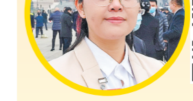
大家好！我是全国人大代表黄晓渝，也是一名医生。

今天是我参加全国人大四次会议的第三天。早上打开窗，见到我非常喜欢的北方景色。今天天气有点冷，在新闻里听到习近平总书记昨天在看望参加政协会议的医药卫生界教育界委员时，讲了很多暖心的话，作为一名医生，我的心暖暖的。 上午8点半，我准备出门去会场。今天上午是小组会议，主要议题是审议政府工作报告。这是我们基层代表最关心的一个环节，希望可以在审议过程中体现基层的呼声。 今天的审议，我第一个发言，公共卫生是我关心的主要话题。2020年新冠肺炎全球蔓延，作为一