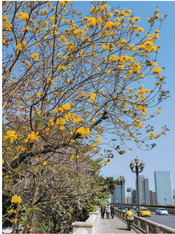
市民在广州大桥自行车道上骑行，桥边的木棉、黄杨风铃、宫粉紫荆正竞相绽放

根据同程旅行数据显示，80后、90后成为当前赏花游的主力消费群体，其中，90后作为各大社交平台的活跃用户，以“直播”“短视频”等方式吸引了大批摄影及大自然爱好者，由此进一步