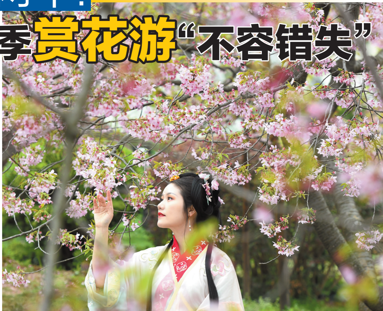
2021武汉东湖樱花节开幕，游客身着汉服在武汉东湖樱花园内赏花留影

基于周边游和本地游的兴起，今年的赏花出行也以自驾和高铁居多，周末“家庭游”更为常见。同程相关负责人称，从区域赏花路线来看，苏州、杭州、无锡、扬州等地是江浙沪游客的热门赏花目的地，南方地区游客则偏爱广州、三亚、厦门。