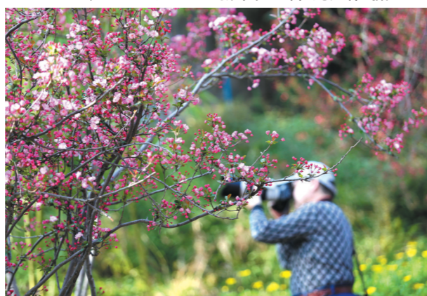
游人在昆明动物园拍摄盛开的樱花