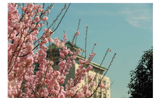
武汉大学早樱绽放

据了解，3月13日至14日为抗疫医护赏樱专场，抗疫医护人员可通过“赏樱绿色通道”进行预约登记。3月5日晚8时，社会公众赏樱免费实名预约通道开启。