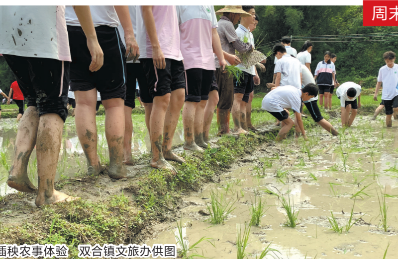
插秧农事体验