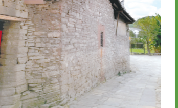
墙和瓦都是石头层层堆叠而成

屯堡里的家具繁琐、富丽，丝毫不逊江南木器。我见到一架五扇木屏风；最上方是山形镂空木雕，雕着虬劲、盘旋缠绕的梅花跟绽开的花朵；中间是云形，两边是扇形的浮雕，贝壳、玉石镶嵌出清雅图案；下面五扇屏风主体，中间是松树和牡丹，俯仰生姿，