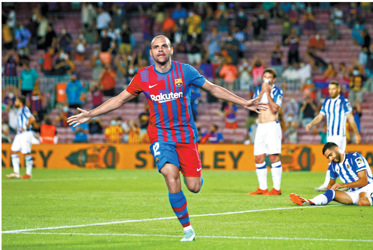
巴萨前锋布雷斯特庆祝进球