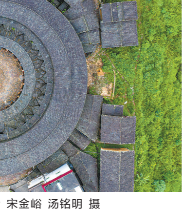
盐田港的公共场所实现了免费WIFI全覆盖

康养旅游方面，惠州博罗县、梅州蕉岭县、大埔县等地以长寿乡、中医药为重点，着力构建“中医药+文化体验+健康服务”发展模式，广州从化区以温泉旅游产业带