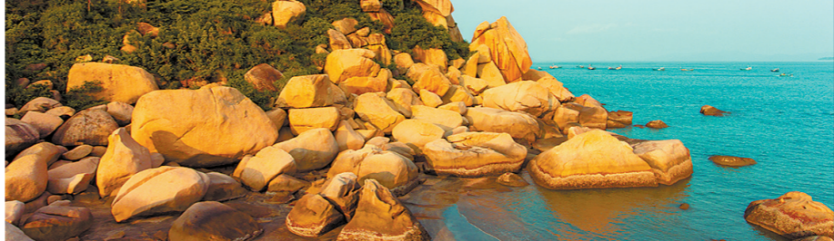
台山那琴半岛地质海洋公园

随着广州、深圳、珠海、惠州、江门、东莞、中山、汕头、潮州、揭阳、汕尾、湛江、茂名、阳江14个沿海地级以上市的文化和旅游行政部门在广州联合签署《广东滨海(海岛)旅游联盟章程》，宣告广东滨海(海岛)旅游联盟正式成立，首届轮值主席单位为广州市文化广电旅游局。据悉，联盟将在“全省滨海(海岛)旅游发展一盘棋”理念统领下，研究解决滨海(海岛)旅游发展的困难和问题，为打造粤港澳大湾区世界级旅游目的地、建设滨海旅游强省目标作出贡献。