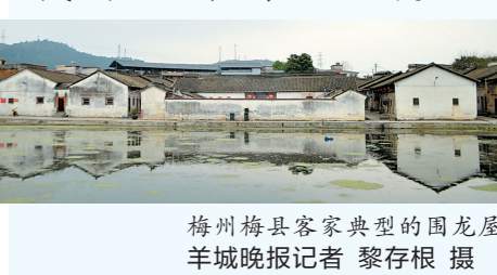
梅州梅县客家典型的围龙屋

2021年3月：广东滨海(海岛)旅游联盟正式成立，包括广州、深圳、珠海、惠州、江门、东莞、中山、汕头、潮州、揭阳、汕尾、湛江、茂名、阳江14个沿海地级以上市。