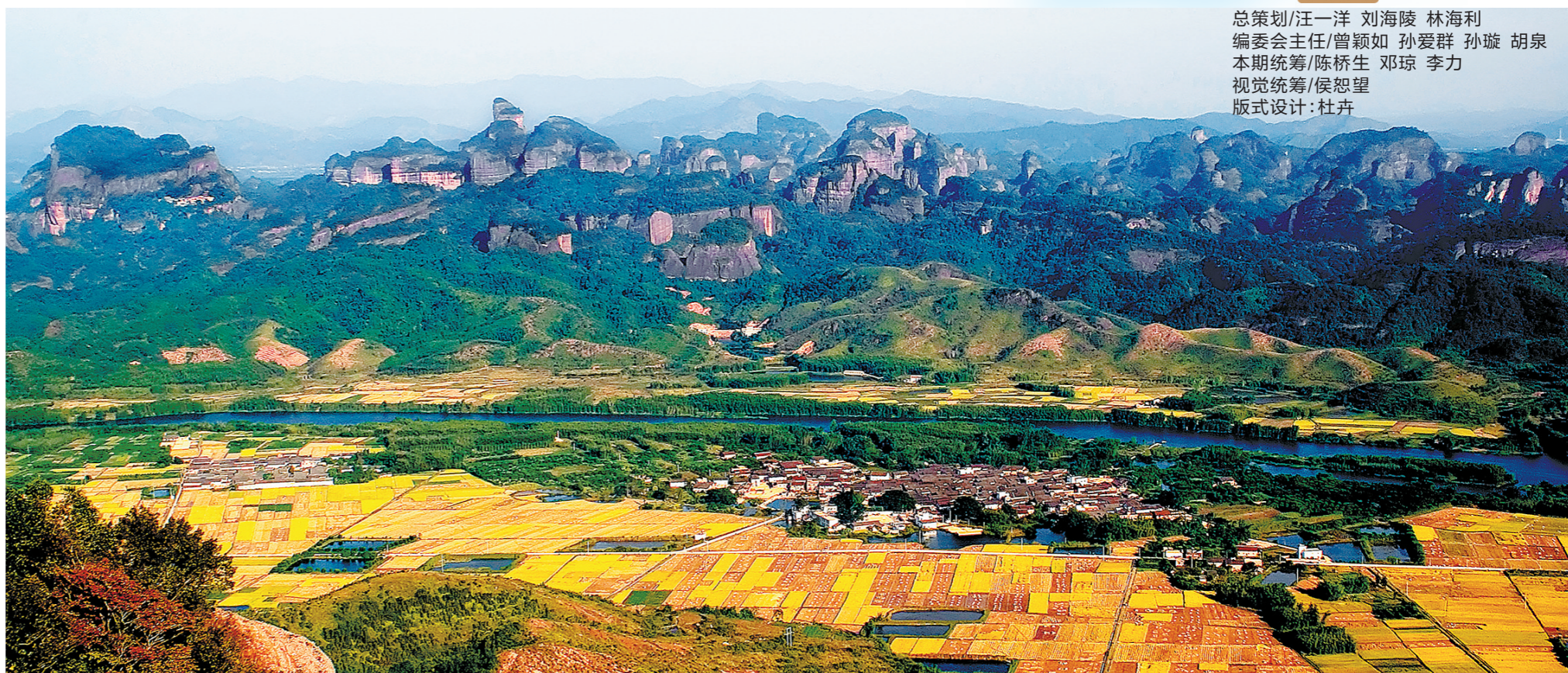
丹霞山所在的韶关仁化县是国家全域旅游示范区

广东省文化和旅游厅党组书记、厅长汪一洋表示，广东将以高质量发展全域旅游为抓手，深化文旅融合发展，奋力将文化和旅游打造成为全省精神文明建设的重要支撑、物质文明建设的重要支柱，努力塑造与经济实力相匹配的文化优势，加快打造粤港澳大湾区世界级旅游目的地，建设更高水平的文化和旅游强省。