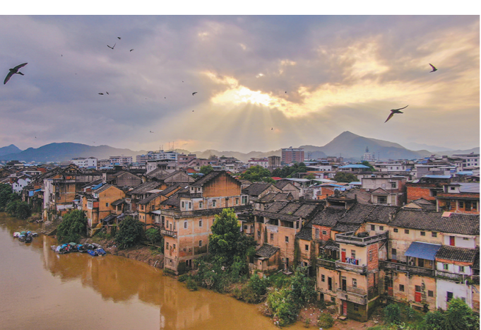
梅州市梅县区松口古镇

在文旅融合方面，广州番禺区积极打造粤港澳大湾区文商融合产业示范区；清远清城区先后引进长隆、广东国际园、梦享谷等重大项目，推动文旅产业集聚区建设及城乡融合发展；珠海斗门区通过