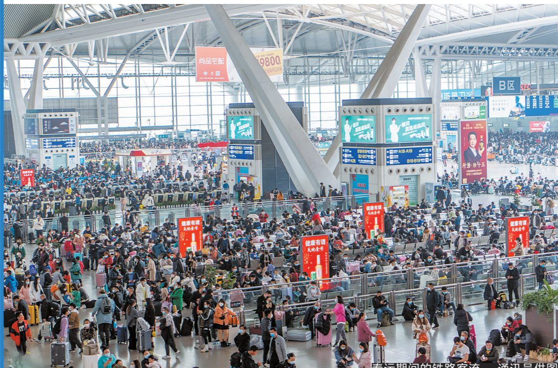
春运期间的铁路客流

羊城晚报 记者李志文、通讯员曾小贤报道：“全国春运看铁路，铁路春运看广东。”珠三角地区作为我国春运发源地，历来是反映我国春运的晴雨表。2月25日，为期40天的2022年春运落下帷幕，广铁集团科学铺画运行图，织牢疫情防控网，为旅客营造了安全健康的出行环境，客货运量实现同比双增。