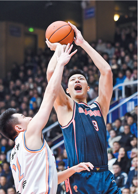
易建联依然是广东队的核心

3月1日至3月22日，2021至2022赛季CBA联赛第三阶段比赛将于广东佛山和辽宁沈阳两地以赛会制形式举行，这也是本赛季CBA常规赛的最后阶段。第三阶段比赛结束后，前12名球队将展开季后赛的争夺。届时，排名第5至第12位的球队将面对淘汰赛，采取单场定胜负决出晋级八强的名额，而排名前四位的球队在首轮轮空，直接进入八强。广东的三支球队同处佛山赛区，从目前的排名来看，他们均有望向季后赛。