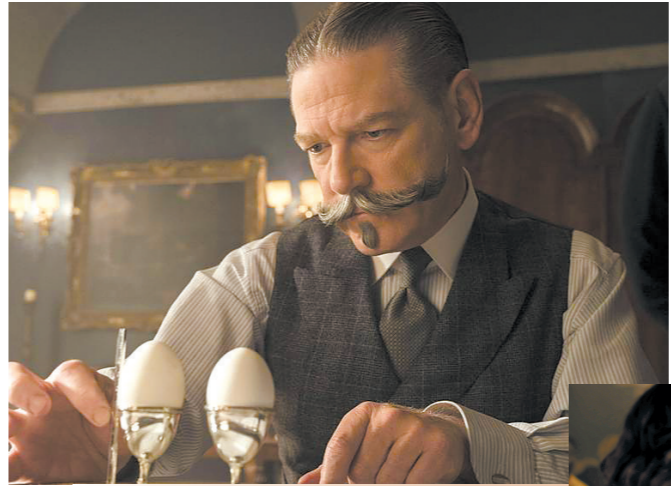
肯尼斯·布拉纳是个好演员，却不是个好导演

让整个案件瞬间失去悬念；更诡异的是，除去与琳内特有感情纠葛的数人，船上其余“嫌疑人”竟然看不出一点作案动机……剩下的时间，早已得出答案的观众不得不一再降智来配合大侦探波洛的表演。一直到电影最后十分钟，波洛才如梦初醒，把所有人锁进屋里解密。与其说是像老年版柯南，大侦探波洛的形象其实更接近于毛利小五郎。 角色塑造方面也是“早的早死，涝的涝死”。故事开头借助布克之口交代完复杂人物关系后迅速放大波洛的个人形象，既交代了波洛的情史，又让波洛有了暗恋对象，代价便是让其他角色都成了面目模糊的“纸片人”。 等到影片后半段波洛开始逐一诘问时，他们口中的“爱恨情仇”因缺乏情绪铺垫显得十分突兀，悬疑片“人人都可能是凶手”的紧张刺激感没渲染出来，观众只好强忍困意一遍又一遍聆听波洛关于“爱”的教诲和自命不凡的分析。 导演肯尼斯·布拉纳的野心显然并非按部就班地塑造出一个“阿婆式”的大侦探波洛。或许，他更想让自己心中的波洛在一次挣扎和反思中成长。在前作《东方快车谋杀案》中，导演有意识地增加的人性探讨在片中俯拾皆是。新版《尼罗河上的惨案》中，关于“爱”的讨论密度同样不小。可惜，这些讨论以单调的大段对话形式强行灌输给观众，悬疑大IP被活活演成了“百家讲坛”。 这部新《尼罗河上的惨案》证明，肯尼斯·布拉纳是个好演员，演出了波洛作为普通人鲜活的一面，也为接下来的大侦探波洛IP留足了成长空间。但在如何把故事讲得引人入胜这方面，肯尼斯·布拉纳显然力有不逮。好在阿婆留下足够丰厚的遗产，一部部翻拍下去，有朝一日未必不能成鱼翻身。