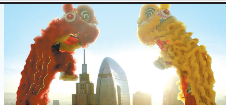
中国传统元素在MV中接连登场