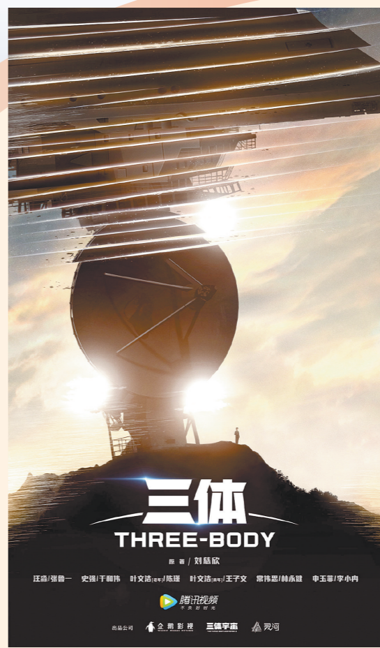
国产科幻剧集《三体》概念海报

据外媒报道，女星艾莎·冈萨雷斯透露，Netflix（网飞）出品的美剧《三体》已经开拍。她同时提到，Netflix版《三体》的出品方还包括了著名影星布拉德·皮特的公司以及女星裴淳华的公司。