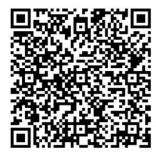
扫一扫，欣赏《中国锣鼓》MV