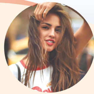
艾莎·冈萨雷斯出演Netflix版《三体》

Netflix版《三体》的主创阵容十分强大。《三体》的作者刘慈欣与《三体》的英文译者刘宇昆在该剧中担任制作顾问，编剧大卫·贝尼奧夫和D·B·威斯曾担任过《权力的游戏》的核心制作，而另一位主创亚历山大·伍也是大热剧集《极地恶灵》第二季的运作人。已公布的演员阵容包括：本尼迪克特·王、艾莎·冈萨雷斯、周采芹、约翰·艾德波、约翰·C·布莱德利、利亚姆·坎宁