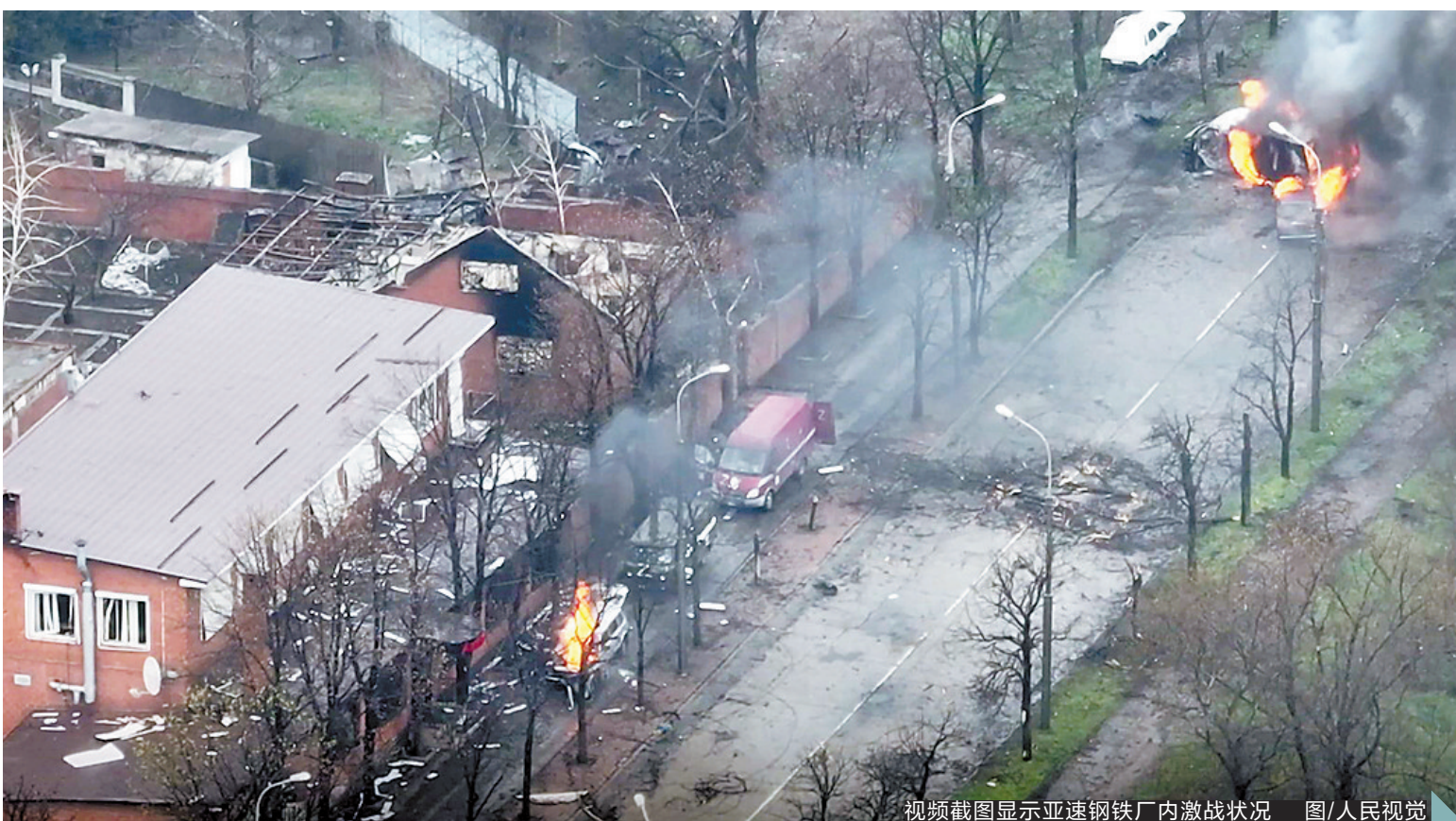
视频截图显示亚速钢铁厂内激战状况 图/人民视觉