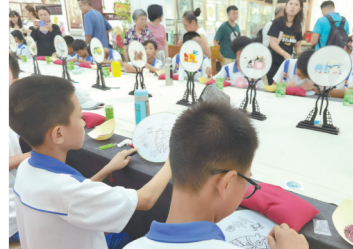
潮州刺绣文化研学游基地学生学习刺绣