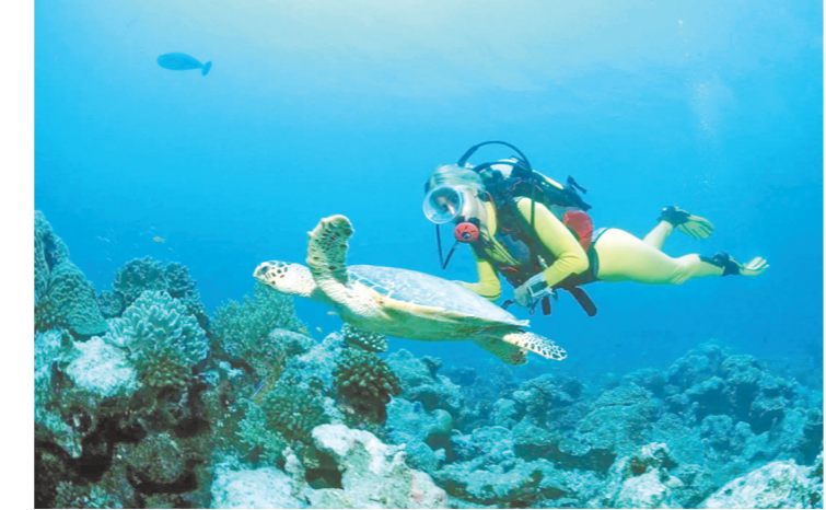
悦榕集团在印尼丹戎推出海龟保育计划