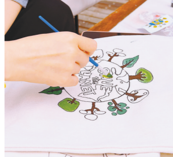
voco千鸟湖阳光大酒店带游客DIY手绘环保袋