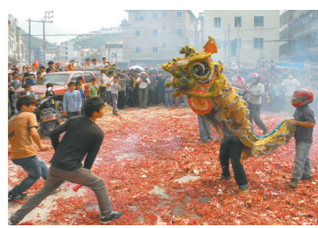
热闹的怀集县下帅舞狮吸民俗(资料图)

乡村非遗项目发掘与保护传承中要始终坚持以地制宜,下足功夫,做好功课,找到非遗与乡村振兴的结合点,以恰当的方式手段加以推动。他以中国民间古法造纸第一村肇庆四会市扶利村为例介绍,乡村非遗传承发展在形式上也要勇于创新。