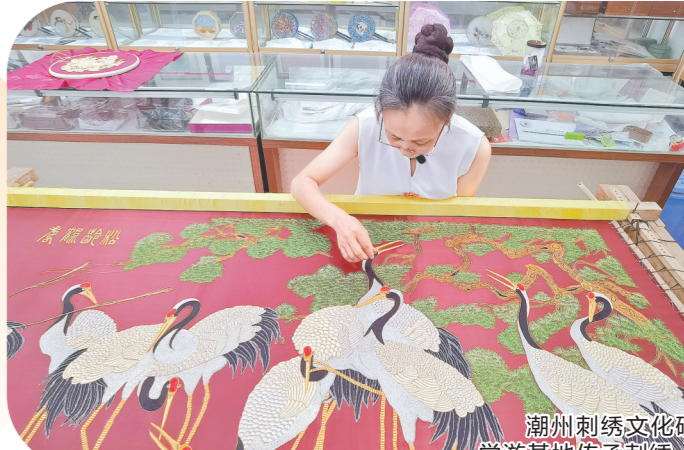
潮州刺绣文化研学游基地传承刺绣