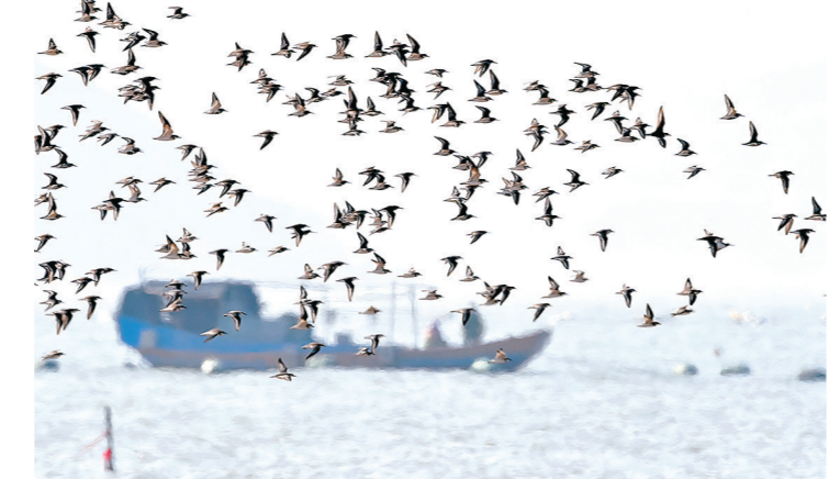
在闽江河口湿地,天空中的鸟群与远处作业的渔船相映成画