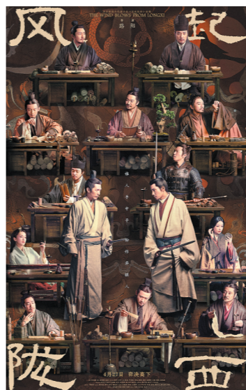
剧中人物如走马灯般登场

此处理,是希望从语言风格上和观众拉近距离,“让观众感受到这个人物的情趣。” 然而,事与愿违,观众不适应仍难消弭:“看着古装,听着现代话,还是很奇怪”“风格不统一,真的很跳戏”。因此,有网友好心劝告还没“入坑”的观众:“不要当成历史正剧看,只当是一个‘借了三国皮’的谍战剧,质量就还不错。当成历史剧看,难免会觉得‘这什么玩意儿’。”