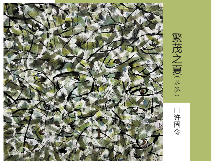
繁茂之夏(水墨) □许国令