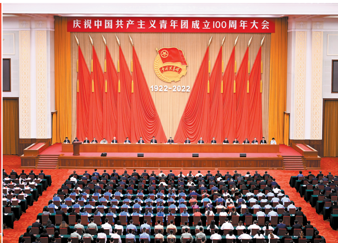
5月10日,庆祝中国共产主义青年团成立100周年大会在北京人民大会堂隆重举行。中共中央总书记、国家主席、中央军委主席习近平在大会上发表重要讲话

新华社电 庆祝中国共产主义青年团成立100周年大会10日上午在北京人民大会堂隆重举行。中共中央总书记、国家主席、中央军委主席习近平在会上发表重要讲话强调,青春孕育无限希望,青年创造美好明天。新时期的中国青年,生逢其时、重任在肩,施展才干的舞台无比广阔,实现梦想的前景无比光明。