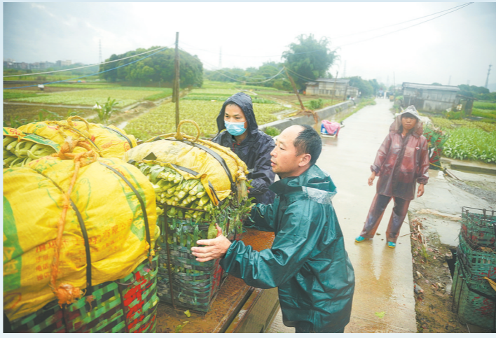
从化区城郊街高步村,工作人员帮菜农把蔬菜搬到车上,一同拉往安置点

记者从广州市应急管理局获悉,截至10日18时20分,广州11个区已落实转移避险安置人数15329人,安置时间均在3天以上,最长7天。对于转移安置人员,各区均妥善安排生活物资,让群众吃住有保障。羊城晚报记者 付怡