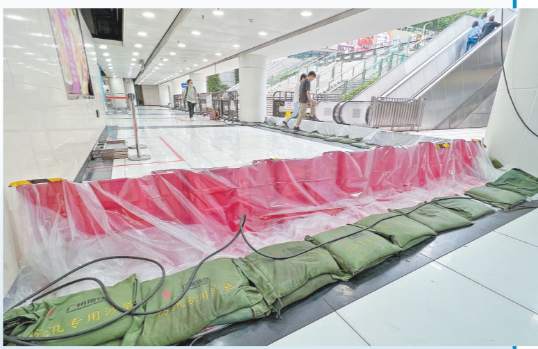
地铁站铺沙袋防汛