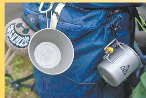
“山系青年”背包挂有实用餐具