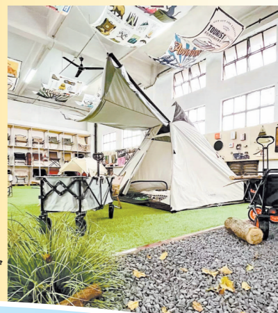
白色系列的郊游产品