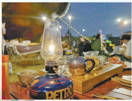
▲点上一盏灯,为郊游增添气氛