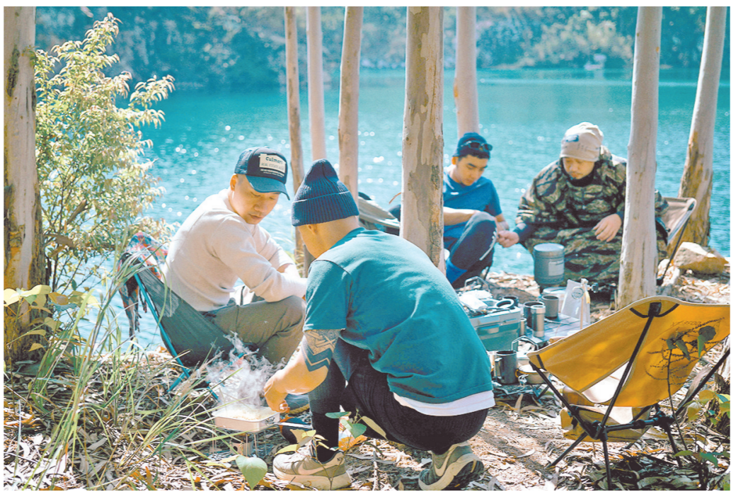
三五知己品茶煮食

“山系生活”的玩法有很多,有的游客喜欢煮咖啡,看着天空放松心情,发呆一整天;有的游客带上整套餐具食材,一显身手,享受烹饪和美食;也有游客带上吉他,上演个人音乐现场秀……但都有一个共性,就是人们走到户外,暂时逃离都市的忙碌与奔波,感受生活的真谛。”AMPM 全日营地相关负责人告诉记者。