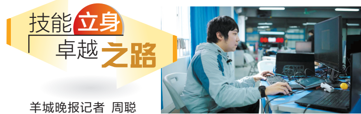
技能立身 卓越之路 羊城晚报记者 周聪

通知要求,全省法院加强与公安、检察、金融监管等部门的沟通协调,准确审查认定并及时查封冻结涉案财产,坚决防止犯罪分子转移财产。综合运用多种手段,做好涉案财产返还工作,最大限度挽回损失,维护好受害老年人的合法权益。加大养老诈骗犯罪典型案例发布,深入揭露养老诈骗“套路”手法,帮助老年人提高法治意识,在全社会形成“不敢骗、不能骗、骗不了”的舆论氛围。