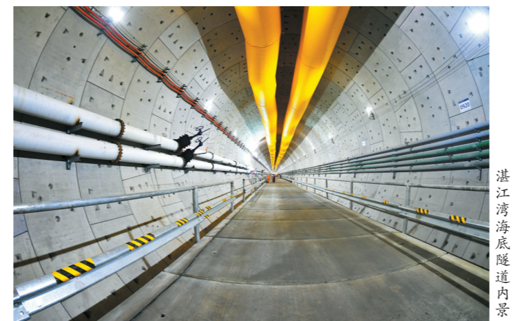
湛江湾海底隧道内景

手硬”。据悉，广湛高铁通车后将实现广州中心城区至湛江中心城区90分钟直达，有助于提升粤西地区区域地位，促进湛江整体经济和社会发展，并在加强广东对外合作“陆海内外联动、东西双向互济”发展中发挥重要引领作用，对湛江建设北部湾中心城市和现代化沿海经济带重要增长极，升级优化交通布局都具有重要推动作用。