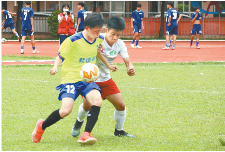
中职组比赛现场