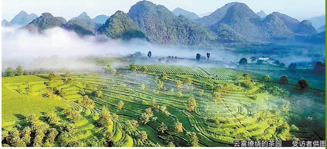
云雾缭绕的茶园 受访者供图

茶品牌价值在不断增长,2020年为27.88亿元;2021年为32.64亿元,同比增长17.07%;2022年为37.18亿元,同比增长13.91%。