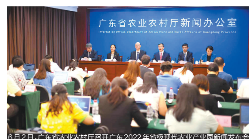
6月2日,广东省农业农村厅召开广东2022年省级现代农业产业园新闻发布会

2018年,广东部署启动第一轮省级现代农业产业园建设,共投入省级财政资金75亿元建设131个产业园,加上珠三角地区自筹资金建设的30个,第一轮共建设161个省级现代农业产业园。在此基础上,2021年-2023年再投入75亿元,开展第二轮省级现代农业产业园建设,打造产业园2.0版。2021年批准建设了74个,加上今年批准建设的53个,广东省第二轮省级现代农业产业园已有127个,省级现代农业产业园总数达到288个。