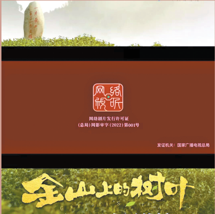
《金山上的树叶》成为第一部获得“网标”的网络电影