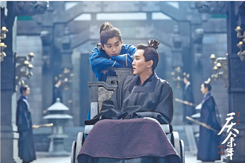
网剧《庆余年》新获第26届白玉兰奖两项大奖

某国内视频网站业内人士接受羊城晚报记者采访时表示：“以前针对重点网络剧，我们需要在制播阶段获得广播电视主管部门发放的‘上线备案号’，而现在需要获得《网络剧片发行许可证》。审核标准和流程方面没有大变化，只不过‘换证’了，更加正式了。”