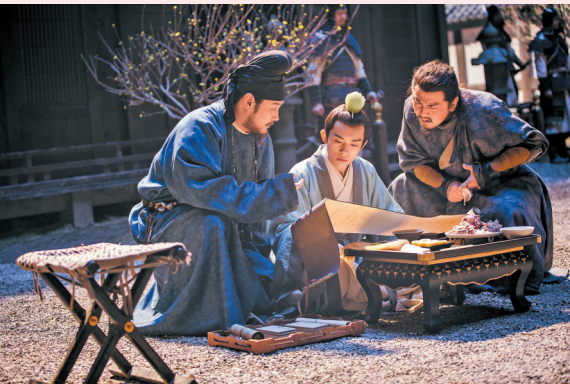
网剧《长安十二时辰》在2020年获得多项大奖