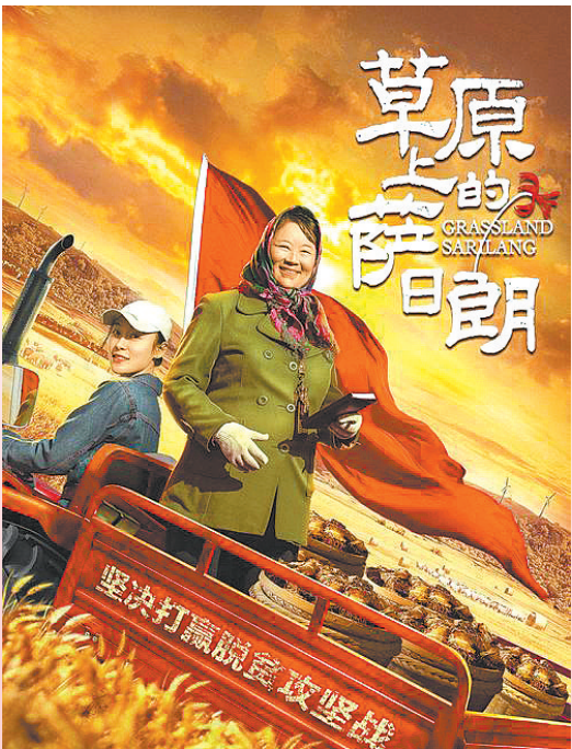
《草原上的萨日朗》是2021年度的优秀网络电影