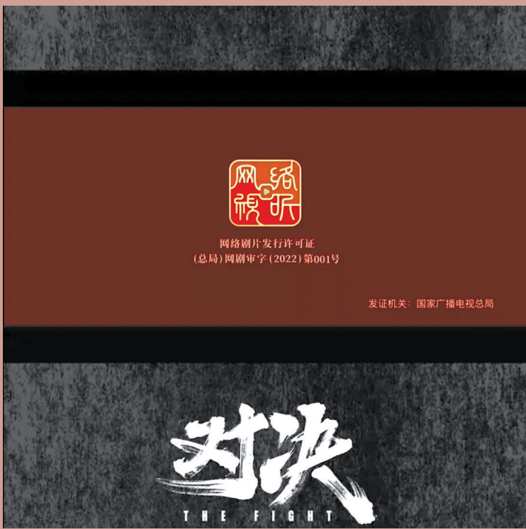
《对决》成为第一部获得“网标”的网络剧

从“上线备案号”时代进入“网络剧片发行许可证”时代后，网络剧片的制播会有哪些变化？近日，羊城晚报记者向专业机构和业内人士寻求解答。