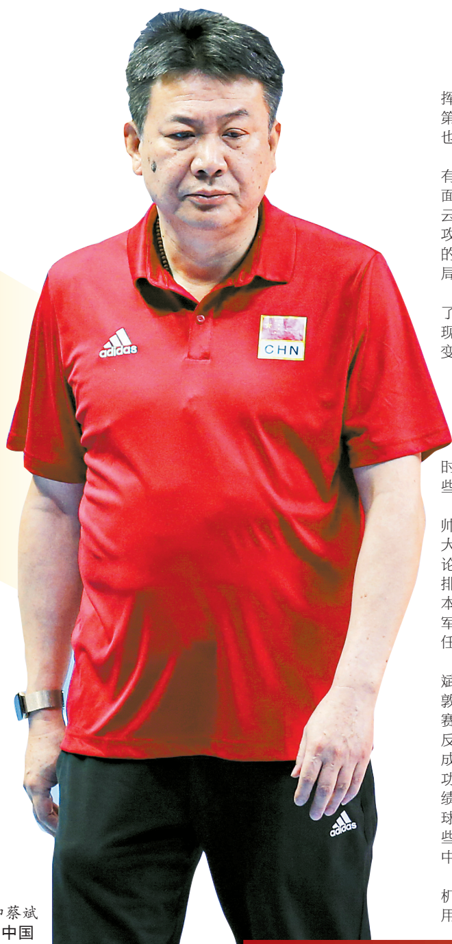
中国女排主帅蔡斌

从三站分站赛12个对手看，中国女排的面对的难易程度呈由弱到强递进，对于2022年首次参加国际大赛的中国队来说是较为友好的节奏。首战意大利队，她们只派出二队出征，但底蕴还在；土耳其队上升势头很猛，在东京奥运会曾以3比0战胜过中国队；泰国队以“快”著称，2009年蔡斌第一次担任中国女排主教练时，就曾因为率队在亚锦赛输给泰国队，最终导致下课，因此这四场比赛对中国队来说锻炼价值都不小。