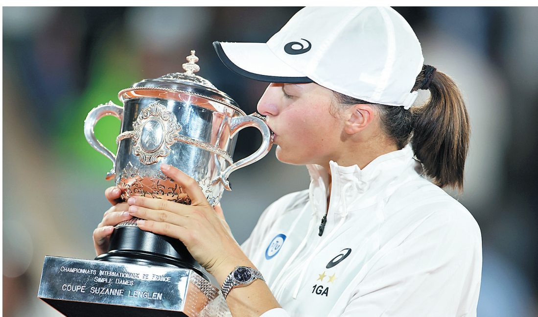
斯瓦泰克获得冠军

2022年法网女单冠军归属日前尘埃落定。在决赛中，头号种子斯瓦泰克以6比1、6比3横扫18号种子高芙，继2020年之后再次夺得法网冠军。斯瓦泰克几乎以一种不可阻挡的姿态拿下了今年的法网女单冠军，在夺冠征途她甚至只输了一盘比赛，那就是在八分之一决赛的首盘输给了中国小将郑钦文。因为斯瓦泰克的强势，本应是巅峰对决的决赛变成了一边倒。实力不俗的高芙在斯瓦泰克面前没有任何抵抗能力。第一盘，斯瓦泰克仅用时32分钟，整整没有送出破发点的她便以6比1轻松拿下。在第二盘开局，斯瓦泰克状态有所波动，高芙首次完成破发，但她没能抓住机会。稳定