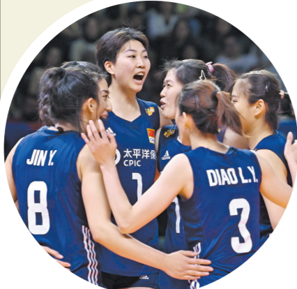
中国女排在世界女排联赛上庆祝得分