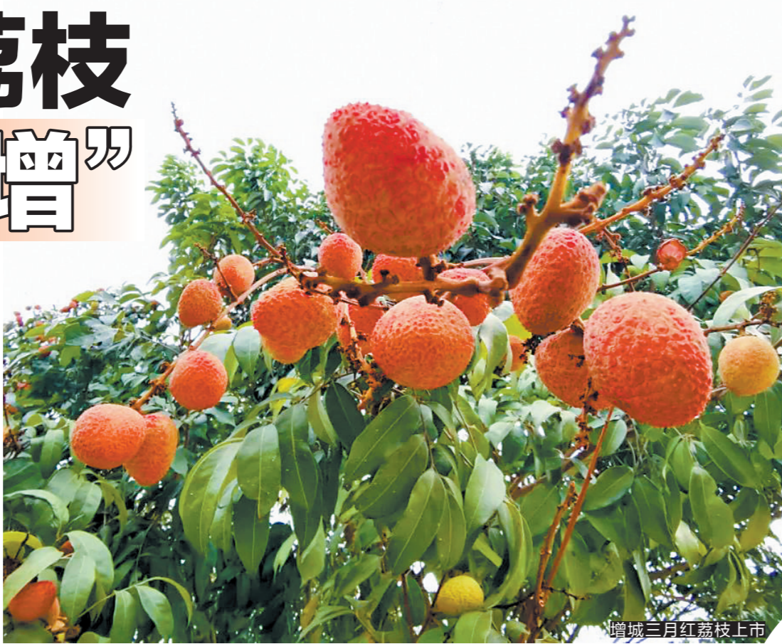
增城三月红荔枝上市

刚结束不久的省十三次党代会,中共广东省委第十二届委员会的报告中指出,“荔枝、菠萝、茶叶、柚子、橘红、陈皮、花卉、水产、畜禽等优质特色农产品卖出了好价钱,农民兄弟心中乐开了花。”农产品如何实现优质优价,无疑是重大的民生课题。记者了解到,面对晚熟、减产等叠加因素,各荔枝主力产区提前谋划,创新举措,助力荔枝销售。