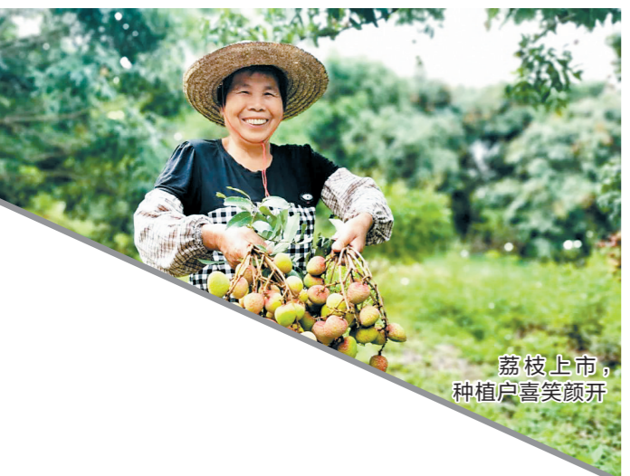
荔枝上市,种植户喜笑颜开

5月17日,2022年广州荔枝“12221”市场营销系列活动启动会上,广州市农业农村局相关负责人介绍,广州今年将有巨美人、无核荔枝、岭丰糯、井岗红糯等荔枝新品种上市。其中,巨