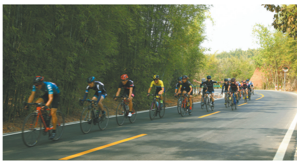
在阅丹公路竹林中骑行