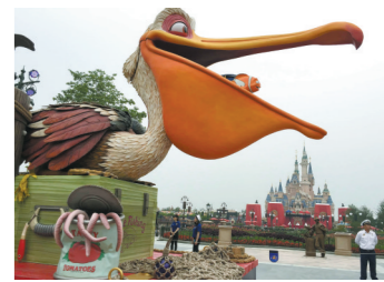
上海迪士尼乐园花车巡游