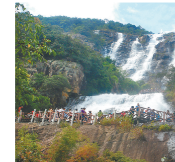
增城荔枝 周聪 增城白水寨仙瀑 (资料图)