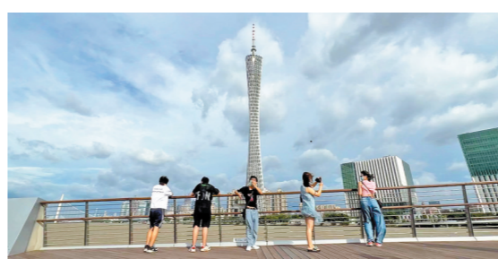
7月1日，“暹芭”逐渐逼近华南沿海，游客打着“艾利”广州地标

羊城晚报讯 记者梁泽韬，通讯员梁巧倩、王天巍、徐青周报道：南海和西北太平洋，在7月1日上演“双风闹海”。继今年第3号台风“暹芭”后，今年第4号台风“艾利”也在菲律宾以东的西北太平洋洋面生成。气象部门预计，“暹芭”将在7月2日正面袭击粤西，广东各地宜尽快做好防御措施。 根据广东省气象台观测，“暹芭”在7月1日17时中心位于湛江市东南方约365公里的海面上，中心附近最大风力11级（30米/秒，约108公里/小时），达到强热带风暴强度。预计，“暹芭”将以15-20公里的时速向西北方向移动，强度继续加强，在近海可能加强为台风级（12级左右）。预计“暹芭”将在7月2日白天在阳江到徐闻之间的沿海地区登陆。另外，原位于菲律宾以东洋面的热带低压已于7月1日11时加强为今年第4号台风“艾利”。广东省气象台观测，“艾利”在7月1日17时中心位于距离日本冲绳县那霸市南偏东方向约640公里的西北太平洋