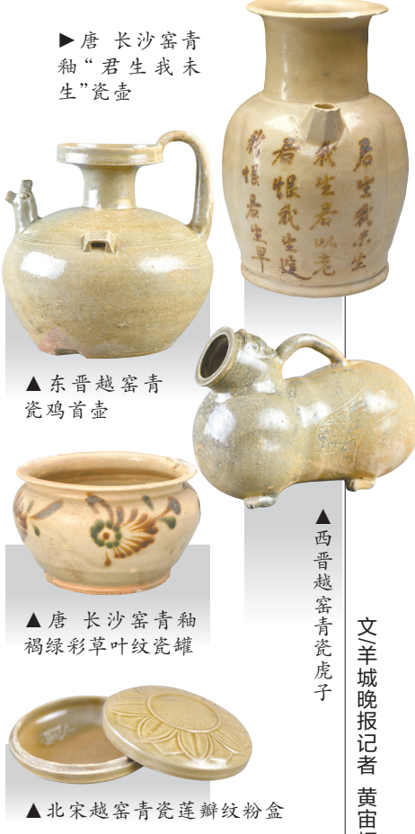
▲唐长沙窑青釉“君生我未生”瓷壶 ▲东晋越窑青瓷鸡首壶 ▲西晋越窑青瓷虎子 ▲唐长沙窑青釉褐绿彩草叶纹瓷罐 ▲北宋越窑青瓷莲花纹粉盒

南越王博物院是一座以南越王墓、南越宫署遗址为基础建立的遗址博物院，为何对中国古陶瓷兴趣如此浓厚？ 南越王博物院陈列展部策展人员告诉记者，该院与中国古代陶瓷的渊源始于上世纪90年代。1993年，爱国实业家、陶瓷收藏家杨永德伉俪将其珍藏的200余件中国古代陶瓷枕捐赠给南越王博物院。博物院一方面为这批文物开辟出专门展厅，举办常设展览永久展出，以供公众欣赏；另一方面确定了征集陶瓷枕类文物的目标，不断加大瓷枕的收藏力度。此后，博物院为深入研究这批来自不同窑口的陶瓷枕，开始策划、推出针对中国古代名窑瓷器的系列展览。 自2015年起，南越王博物院开始系统、有序地推出中国古代陶瓷系列展。目前已举办的该系列展览包括：2015年的《发现邢窑》、2016年的《美成在久——中国原始青瓷展》、2017年的《枕语——西汉南越王博物院馆藏展》、2018年的《吉州窑——江西省博物馆馆藏吉州窑瓷器展》、2019年的《面向海洋——长沙窑瓷器精品展》、2021年的《发现越窑——上林湖越窑青瓷展》、2022年的《发现定窑》。此外，2019年，南越王博物院结合最新