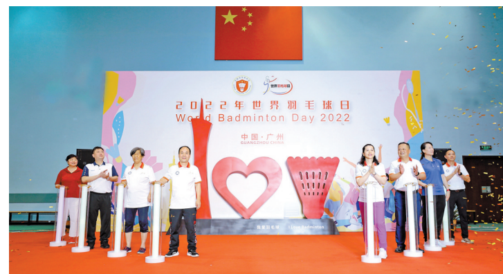
揭幕仪式现场

羊城晚报讯 记者苏荐报道：今年3月，世界羽毛球联合会将7月5日定为首届世界羽毛球日。为进一步推广广州羽毛球项目，传承广州羽毛球冠军精神，2022年世界羽毛球日暨2022年羊城运动汇·广州市第十六届“市长杯”羽毛球系列大赛启动仪式昨日在广州市羽毛球运动管理中心举行。本次大赛由中国羽毛球协会作为指导单位，广州市羽毛球运动管理中心、广州市羽毛球协会主办。