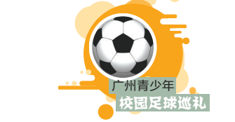
广州青少年校园足球巡礼

2022年广东省青少年校园足球夏令营初中组的选拔活动前日在五华横陂足球小镇圆满结束，来自全省21个地市的431名小学生在为期三天的测试与选拔中赛出水平、踢出激情。