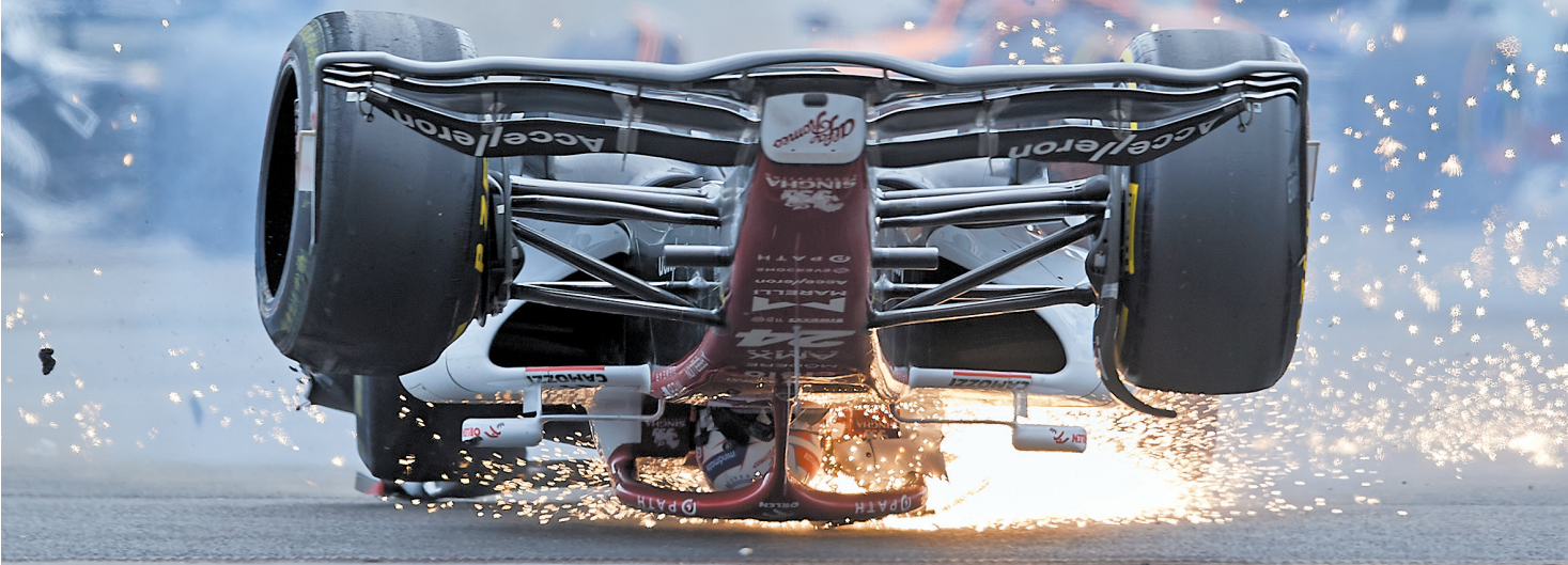
周冠宇被撞翻车的一幕

中国车手周冠宇在最近的F1大奖赛英国站比赛中死里逃生，惊心动魄的事故瞬间画面被无数次地重放——在起步阶段的多车相撞事故中，他的赛车被侧后方对手的赛车顶翻，侧翻在地面上高速行驶，最终翻过围栏，卡在了围栏和看台之间，赛车大面积损坏，这是一起场面上非常严重的事故。幸而不久之后传来消息，在被救出之后，经过紧急医疗评估，周冠宇无碍。