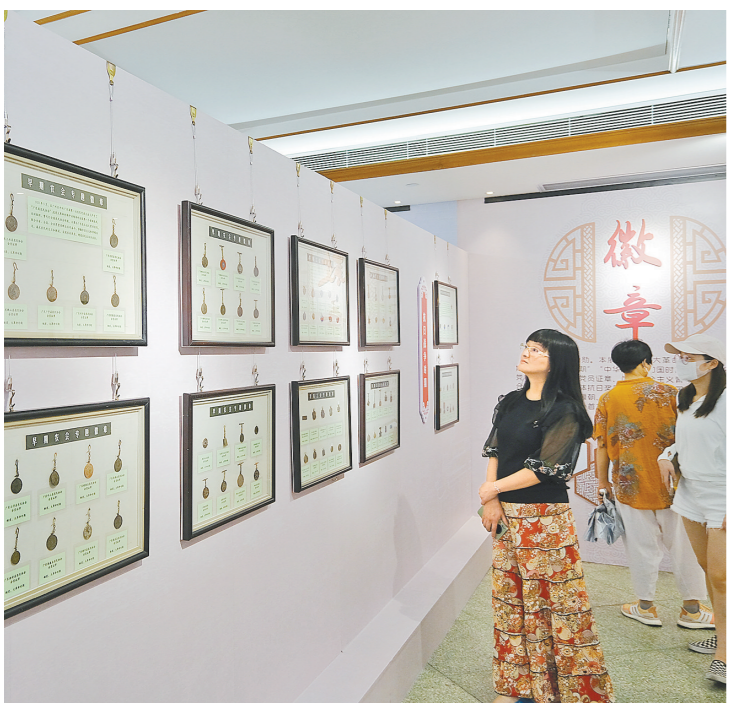
观众在看展

号称“广州第一证”和“广州第一票”的展品在本次展览中非常引人注目，它们是广州市粮食公司购粮证(1953-1954)和广州市粮食公司购粮票(1954)。这