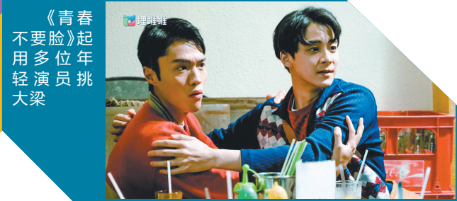
《青春不要脸》起用多位年轻演员挑大梁