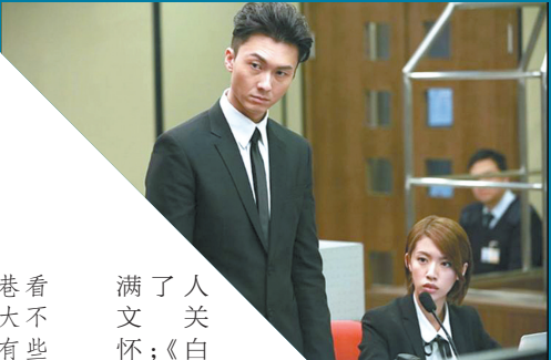
《盲侠大律师》是首部内地视频平台与TVB联合出品的剧集