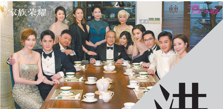
《家族荣耀》有众多内地观众喜爱的熟面孔