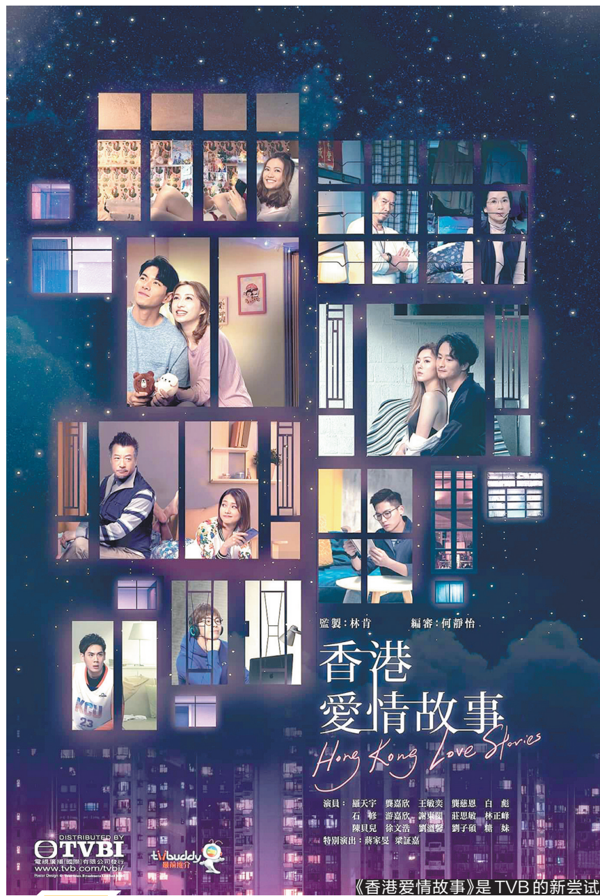
监製:林育 編審:何韻怡

比如,《香港爱情故事》全剧都在香港著名的大型屋邨——华富邨实拍,在荧幕上真实还原香港公屋的居住环境。去年在香港和内地网络平台首播的《清洁师》则