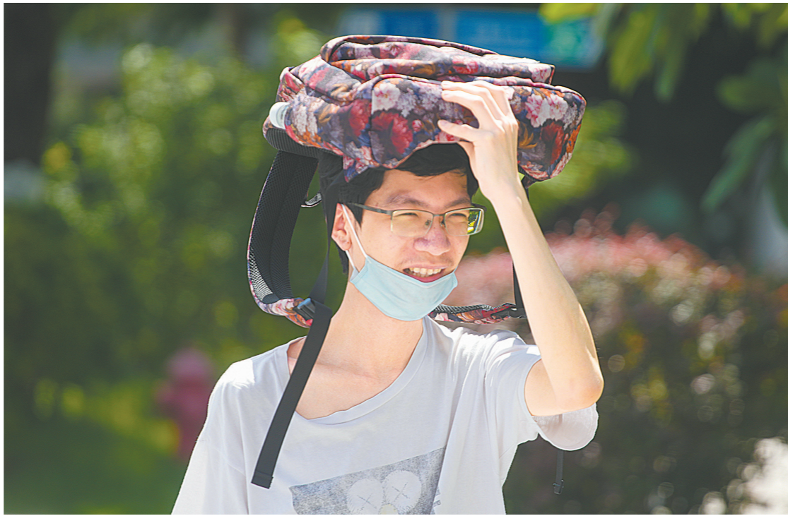
广州一市民用书包遮挡午后阳光

广东省气象台7月11日提醒，近期广东普遍天气炎热，各地居民需注意防暑防晒；广州市气象台提醒，近期参与户外核酸检测工作的市民和工作人员需注意在高温天气中防晒补水，尽量避免在中午温度最高时于户外进行核酸检测工作。除了做好防暑降温工作，广东省和广州市气象部门均提醒需要留意高温炎热天气下局地突发的雷雨天气，防范“下开水”对生活工作的影响。